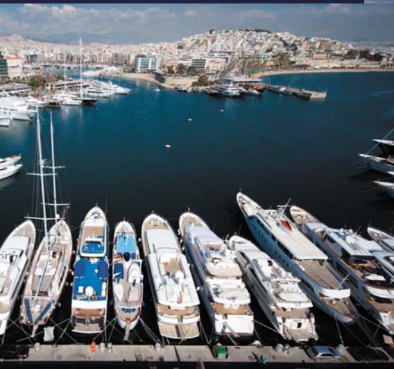
Ελλιμενισμός πολυτελών σκαφών.